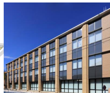
短期大学部棟 1 階